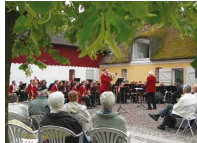
Greve Harmoniorkester giver koncert på gårdspladsen