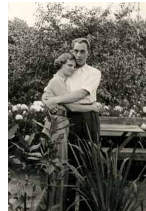
Foto fra sommerhuset Klinten.

Få flere oplysninger på museets hjemmeside ca. 1 uge før et arrangement eller en udstillingsåbning.